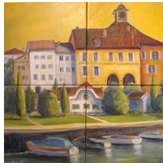
Trois œuvres de Rita Mancesti